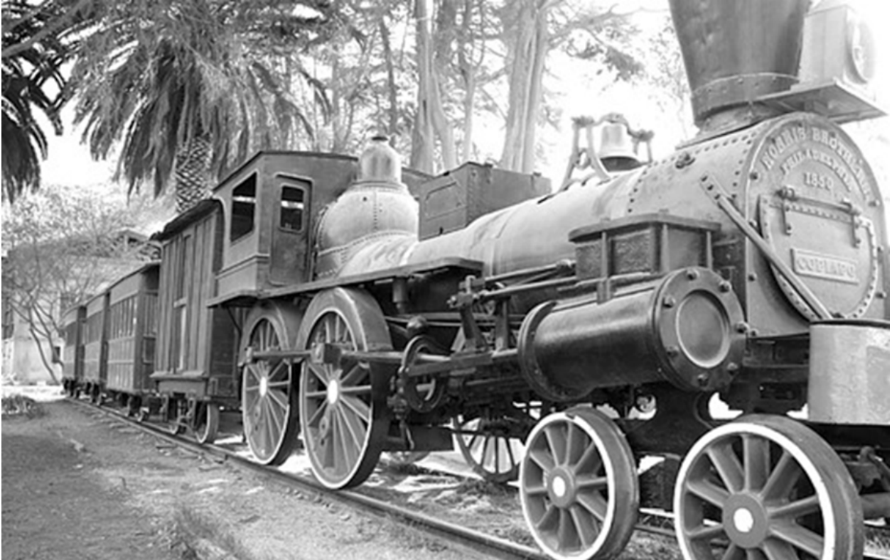
Figura 5: Locomotora La Copiapó, ubicada actualmente en el campus de la Universidad de Atacama.