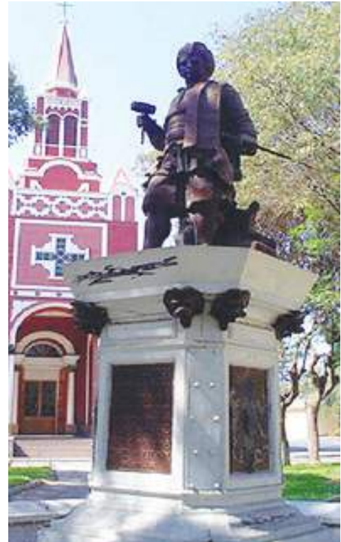
Figura 3: Monumento de Juan Godoy Normilla, ubicado en la Alameda Manuel Antonio Matta, en Copiapó, Chile.