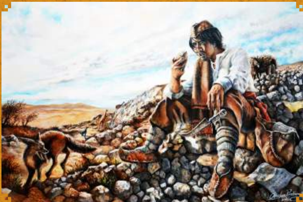
El descubrimiento, óleo sobre tela de Christian Rivadeneira.